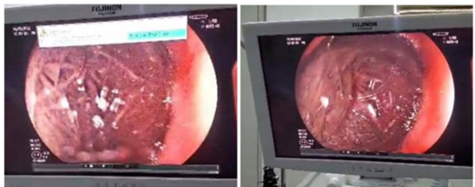
Figura 2. Imágenes de endoscopia digestiva superior (A y B): se evidencia cuerpo extraño constituido por restos alimentarios y pelo que ocupa aproximadamente el 90 % de la cavidad gástrica. Las estructuras filamentosas corresponden a pelo (Tricobezoar).

Endoscopia digestiva superior: 1. Úlceras y erosiones esofágicas 2. Cuerpo extraño: constituido por fibras de cabello oscuro, que ocupa el 90 % de la circunferencia y 90 % de la luz. 3. Úlceras gástricas. (Figura 2)