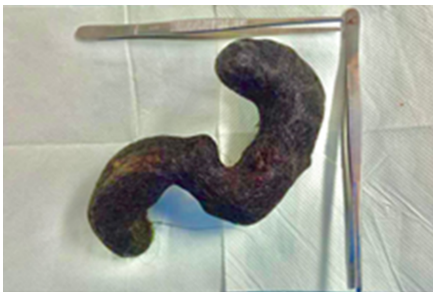
Figura 4. Espécimen quirúrgico moldeado por la forma de estómago y duodeno extraída de forma íntegra constituido por cabello humano oscuro.

La paciente evolucionó de forma satisfactoria, con evaluación y seguimiento por el servicio de psiquiatría, por lo que se decidió su egreso en el posoperatorio mediato.